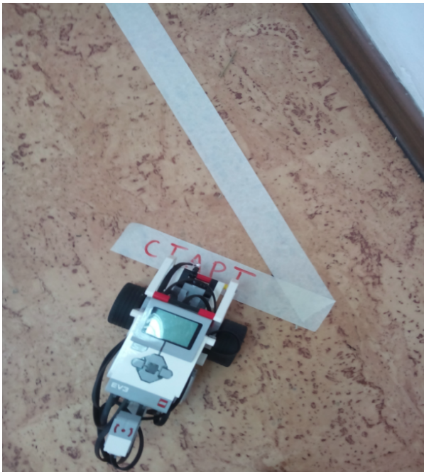
Начало испытаний. Устройство на стартовой линии.